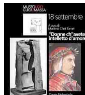
La locandina dell'evento al Mug

All'iniziativa, la cui regia è affidata al critico d'arte Lodovico Gierut che introdurrà l'evento, non mancheranno, come supporti scenografici, opere di Ugo Guidi, Clara Mallegni e Massimo Facheris.