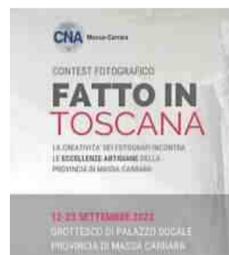
Dodici le aziende in mostra

Massa Nel grottesco di Palazzo Ducale le foto d'autore di "Fatto in Toscana". Sarà inaugurata domani lunedì 12 settembre, alle 11 la prima mostra fotografica promossa da Cna Massa-Carrara che racconta, attraverso la lente di quattro fotografi professionisti che hanno partecipato al contest, la poetica quotidianità di 12 aziende artigiane della provincia. Dodici le fotografie esposte, una per ciascuna azienda che ha partecipato all'insolito ed originale concorso nato con l'obiettivo da un lato di far conoscere alla platea di imprese del territorio i tanti e bravi fotografi professionisti che operano sul campo anche alla luce della crescente necessità di presentarsi al mercato nella maniera giusta attraverso social, blog aziendali, newsletter, sito ed altri supporti digitali e dall'altro di promuovere le peculiarità artigianali e tradizionali apuo-lunigianesi. Le foto sono firmate dal vincitore del contest Paolo Maggiani, Lara Mignani, Paola Tazzini, Lara Mignani, Paola Tazzini, Gianluca Cerrata del Foto Studio Reflex. Dodici, come anticipato, le imprese che si sono trasformate in veri e propri set naturali. Sono ARC edil dei F.lli Cappè Srl, Fran-